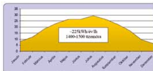
Várható energiahozam helyszíni besugárzási adatok alapján (Budapest)

A VBP tetőventilátorok megújuló energiaforrással kombinált üzemeltetésével, még tovább csökkenthető a felhasznált villamosenergia mennyisége. Ezáltal az optimális légcserével minimálisra csökkentett szellőzési hőveszteség mellé jelentős villamosenergia megtakarítás is párosulhat.