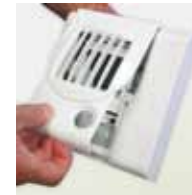
3. ábra: Légelvezető mozgásérzékelőjét működtető elem cseréje:

A helyiség elhagyása után, időkésleltetéssel, a zsalu visszaáll a helyiségben lévő páratartalomnak megfelelő állásba, a „csak” mozgásérzékelős légelvezetőknél minimum helyzetbe.